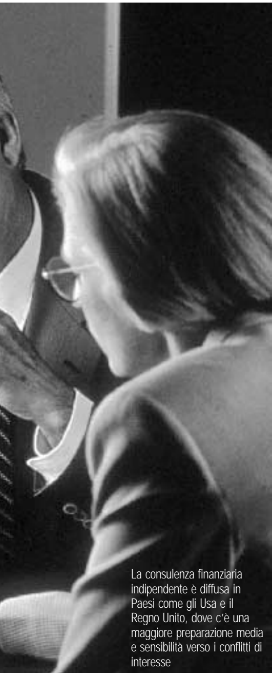
La consulenza finanziaria indipendente è diffusa in Paesi come gli Usa e il Regno Unito, dove c'è una maggiore preparazione media e sensibilità verso i conflitti di interesse

Alcuni piccoli intermediari offrono servizi di pianificazione a fianco di quelli che vengono remunerati a commissione